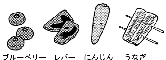
ブルーベリー レバー にんじん うなぎ

10月10日は「目の愛護デー」です。目が疲れると頭痛や肩こりなどの症状を招くことがあります。遠くを見るなどして目を休ませるほか、日頃から栄養バランスのよい食事を取り、疲れ目に効果的な食べ物を積極的に食べるようにしましょう。